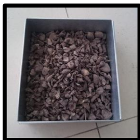
Gambar 2. Cangkang Kelapa Sawit

Selain itu, limbah kelapa sawit yang digunakan yaitu abu boiler kelapa sawit sebagai ganti agregat halus. Penggunaan abu boiler kelapa sawit halus tetap harus di campur dengan pasir beton karena butiran yang sangat halus sehingga tidak dapat mewakili ukuran gradasi pada agregat halus. Pada Gambar 3 merupakan bentuk dari abu boiler kelapa sawit yang sudah. Penggunaan abu boiler kelapa sawit pada penelitian ini digunakan sebanyak 10% dari jumlah agregat halus dan 20% dari agregat kasar untuk cangkang sawit kasar. Penggunaan cangkang kelapa sawit pada beton juga tidak digunakan terlalu banyak karena kandungan minyak yang terkandung dalam cangkang kelapa sawit yang dapat mengakibatkan penurunan kualitas beton.