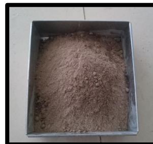
Gambar 3. Abu Boiler Kelapa Sawit